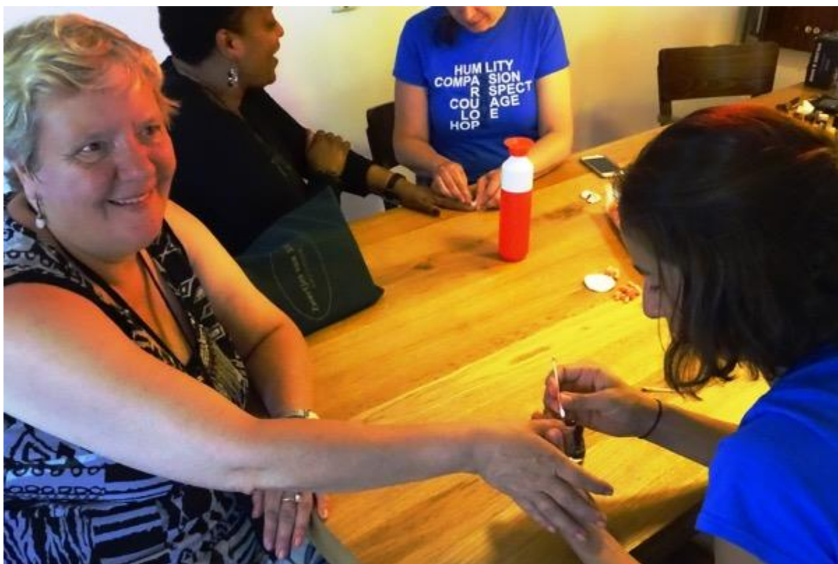
Een beautydag voor verstandelijk beperkten bij Philadelphia

Serve the City biedt mensen de mogelijkheid om zich op een laagdrempelige wijze in te zetten als vrijwilliger.