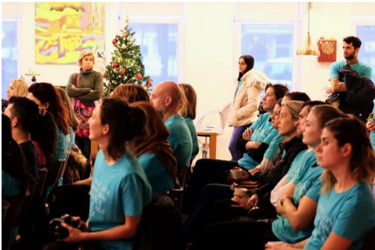
Vrijwilligers tijdens de kick off van een projectdag

Bij ieder Serve the City event is er aan het einde van de dag een moment waarop alle vrijwilligers samen eten. Wij vinden het belangrijk om de vrijwilligers te bedanken voor hun inzet en hen de mogelijkheid te geven om na te praten, te evalueren en ervaringen te delen met vrijwilligers die andere projecten hebben gedaan. Ook de maaltijden worden door vrijwilligers klaargemaakt.