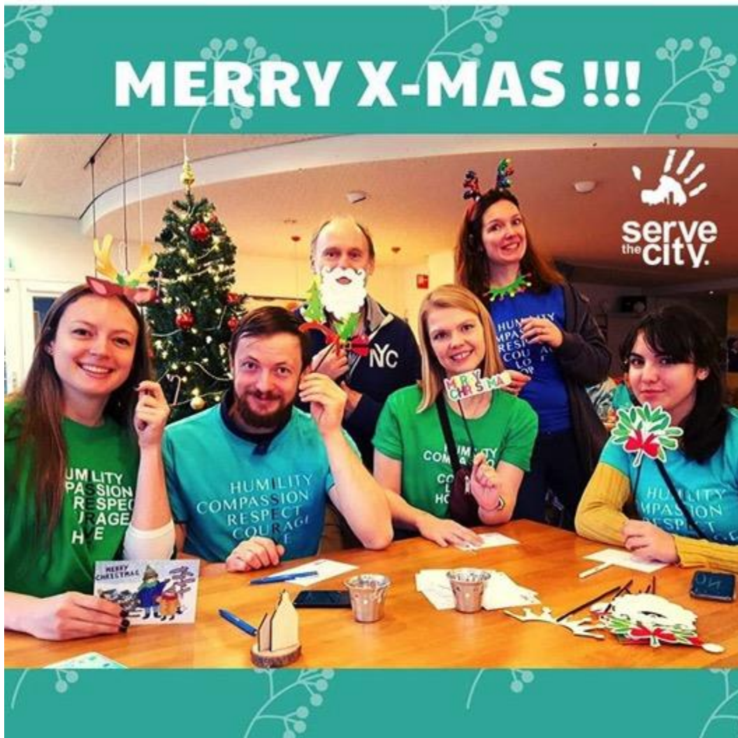
Vrijwilligers tijdens een projecten van 500 heroes in December