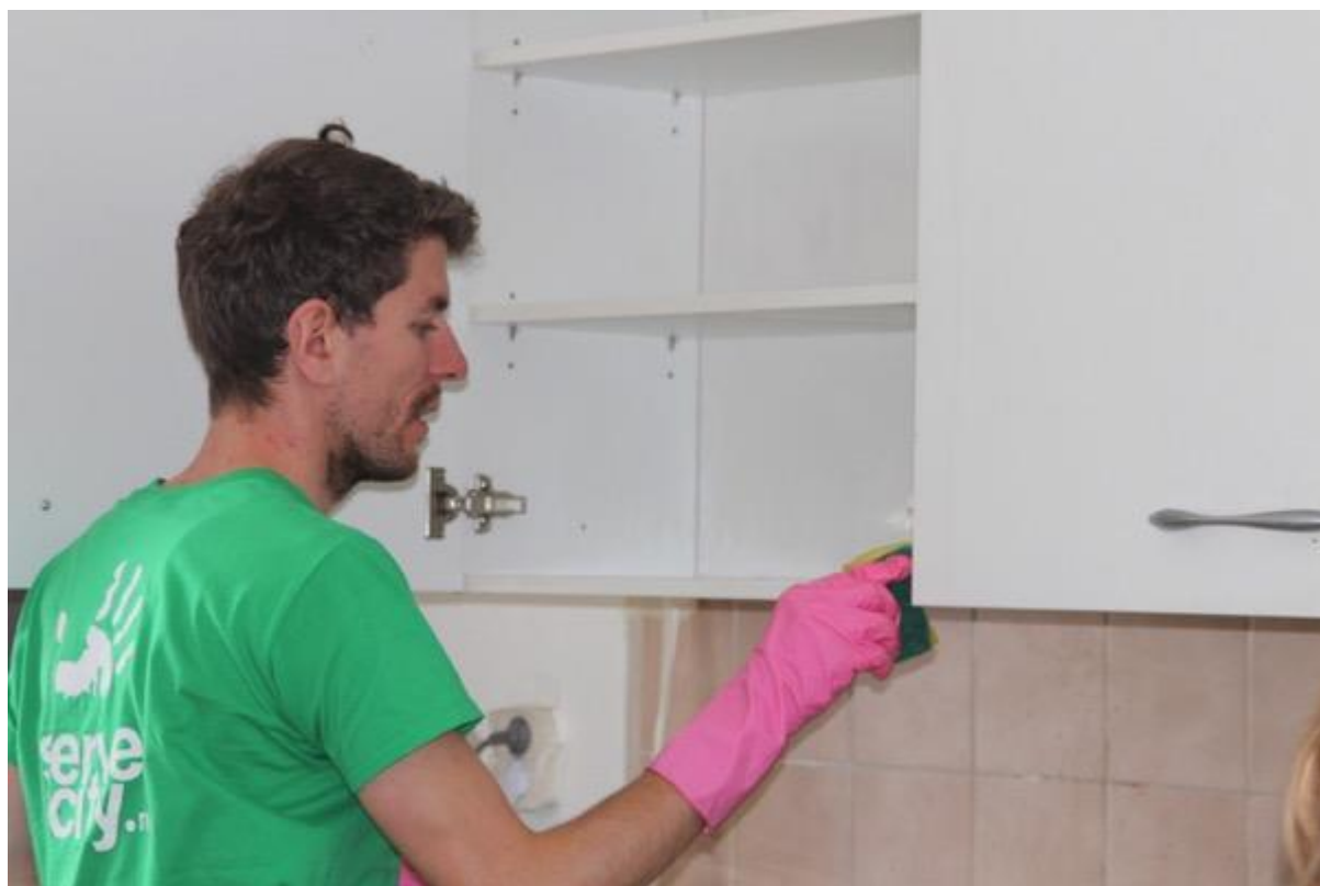
Schoonmaakklus bij een alleenstaande vader van drie zonen.